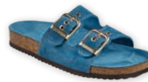
Bengale BLEU DORÉ