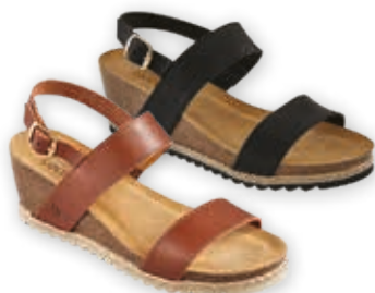
Santana CAMEL, NOIR