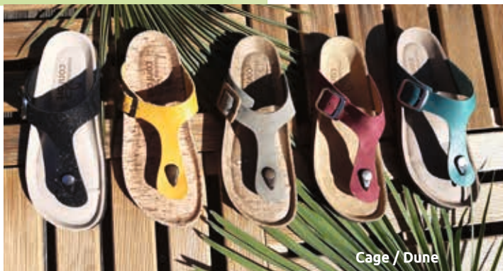
Cage / Dune